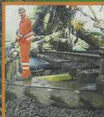
Waschfabrik auf Schienen: Der 1200 Meter lange Gleisbauzug schlängelt sich durchs Siegerland