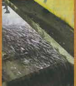
Die Waschmaschine Bis zu 150000 Liter Wasser rauschen stündlich durch die Schotterwaschanlage